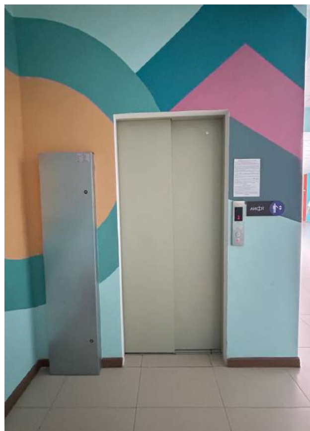
Қимыл-қозғалыс мүмкіндігі шектеулі жандарға арналған инво-лифт мектептің әр қабатын қол жетімді етеді