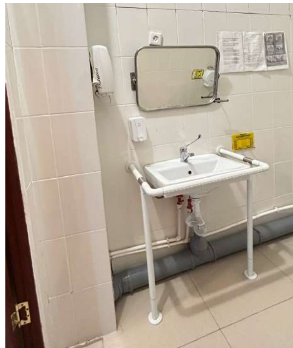
Мүмкіндігі шектеулі жандарға арналған инво-дәретханалар мектеп ғимаратының әр қабатында орналасқан